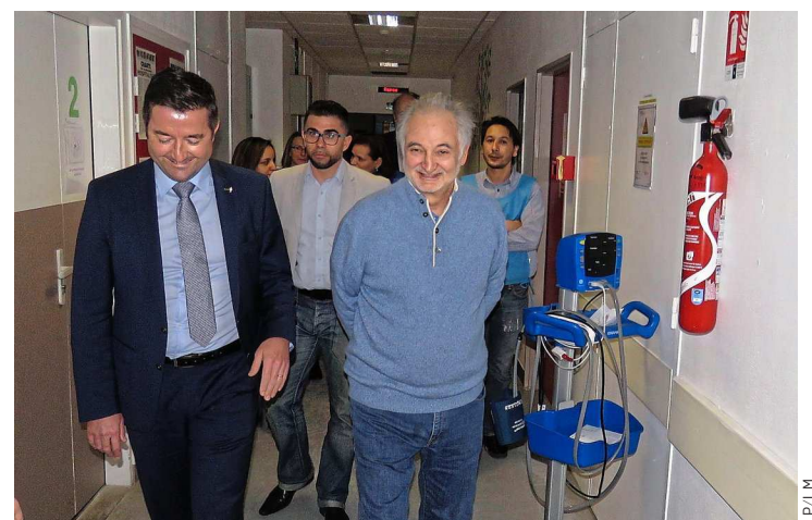
Poissy, samedi. Jacques Attali, président de Positive Planet, ici avec le maire (LR) Karl Olive, a rendu hommage aux 70 bénévoles qui ont mené à bien le défi.

Cette opération est l'une des cinq actions thématiques du programme L'Union fait la France, qui se déroule depuis le 28 mars et jusqu'à jeudi un peu partout dans le pays. « Jeudi, nous serons à Paris pour un banquet à l'intention de ceux qui sont dans la rue », ajoute Jacques Attali, qui con-