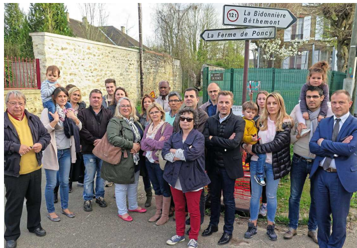
Poissy, vendredi. Les habitants du hameau de la Bidonnière sont invités par la mairie à une réunion publique tout spécialement à leur intention.